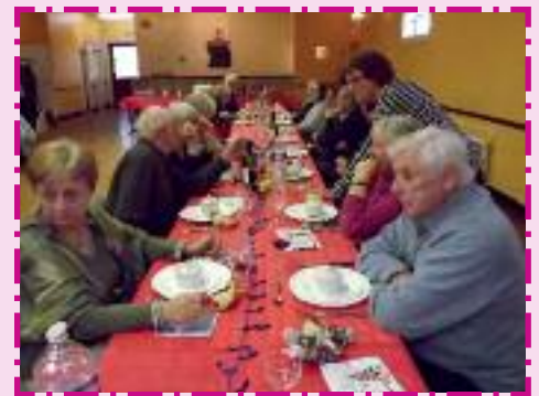
16 décembre 2018 : moment convivial avec nos aînés