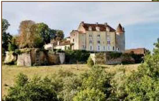
Château de Montréal à Issac