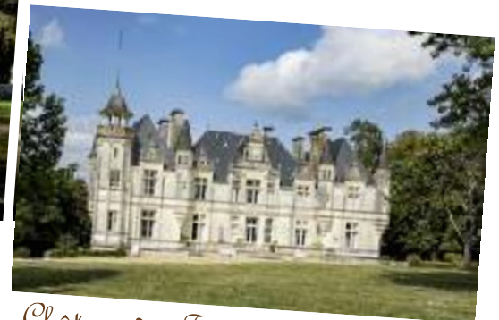
Château des Fournils à Beaupouyet