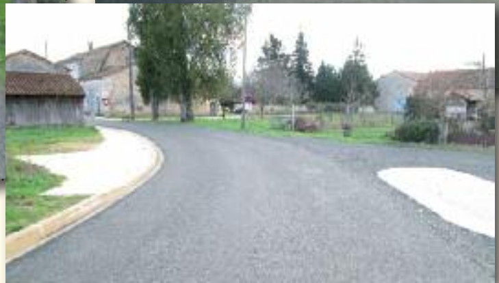
Été 2018 : aménagement du Bourg