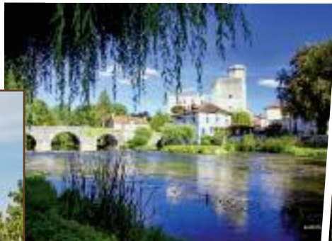
Château de Bourdeilles